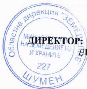
ДИМИТЪР ВЪРБАНОВ /

Обжалването на заповедта не спира изпълнението ѝ.