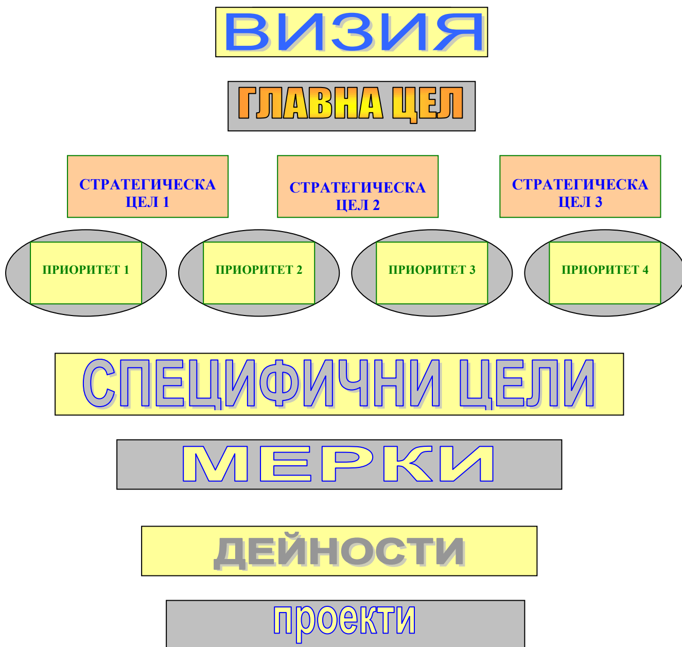
Фиг.1 Логиката на интервенциите в Програмата за реализация на ОПР

Определената логика на интервенции изисква разработването и изпълнението на мерки, дейности и проекти, които са групирани по формулираните приоритети за развитието на община Върбица.